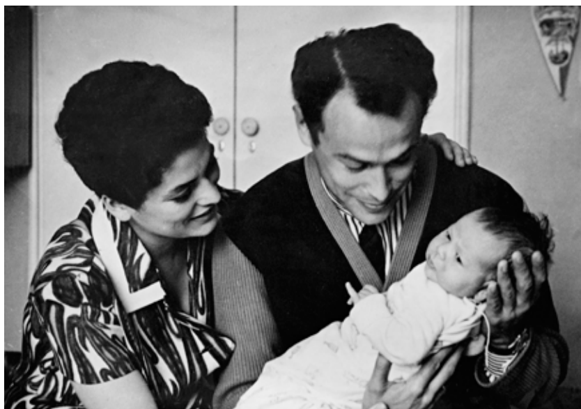
Meie perekond, august 1967.